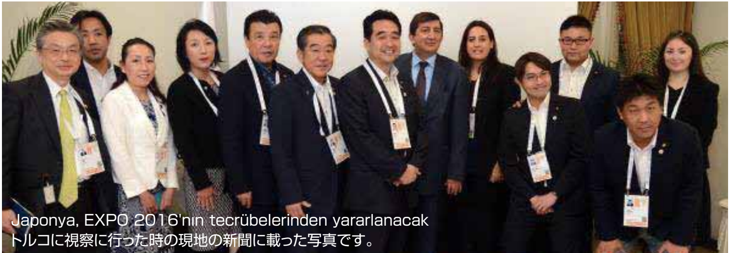
Japonya, EXPO 2016'nin tecrübelerinden yararlanacak トルコに視察に行った時の現地の新聞に載った写真です。