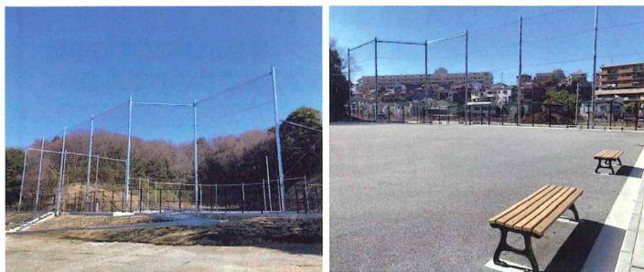
打越広場(多目的広場)現況(令和6年2月撮影)

令和4年に開園した舞岡八幡山しぜん公園は現在も整備を進めています。3月25日にはサッカーやソフトボールなどの練習に利用できる打越広場(多目的広場)がオープンします。施設の計画もほぼ固まりつつありますが、市に先の夏場の子どもたちの遊び場づくりを踏まえた様々な年代の子どもたちが安心して水と親しむことができる公園としての機能を加えることを検討して欲しいと伝えました。担当課からは「前向きに検討したい」との言葉を聞くことができました。今後も子地域の中で子どもたちに必要な環境を整備していきます。